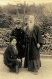
△妻・緑畝、長男・秀一と