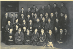
△秀畝と伝神洞塾生たち