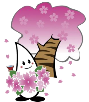
伊那市イメージキャラクター 「イーナちゃん」