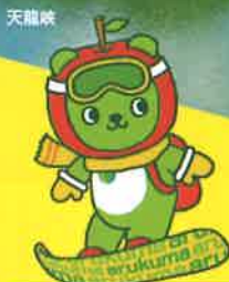
長野県PRキャラクター 「アルクマ」 ©長野県アルクマ